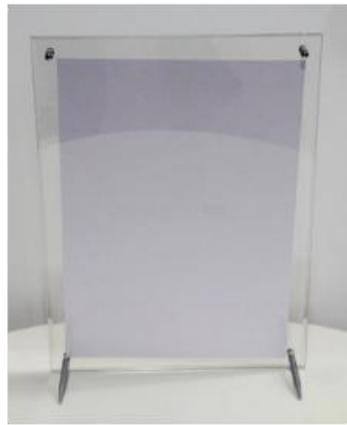
安装完成背面图示例