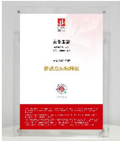
安装完成正面图示例