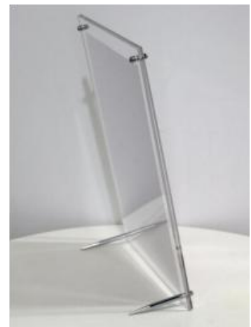
安装完成侧面图示例